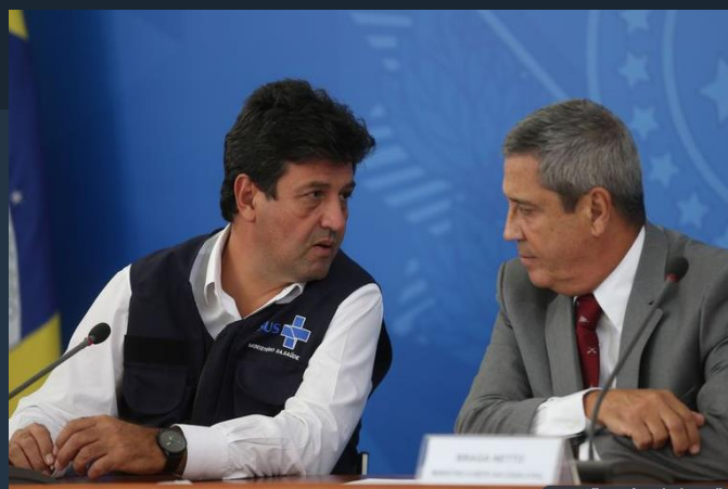
Veja ou reveja aqui a apresentação dos dados do dia

Chegaram ao Brasil hoje as primeiras 500 mil unidades de testes rápidos para diagnosticar a covid-19. Esse primeiro lote é parte de um total de 5 milhões de kits adquiridos pela Vale e doados ao Ministério da Saúde. Os profissionais que estão na linha de frente da pandemia, incluindo agentes de segurança, são o público-alvo. Antes de serem distribuídos, os testes vão passar por uma análise de qualidade pelo Instituto Nacional de Controle de Qualidade em Saúde (INCQS), da Fiocruz.