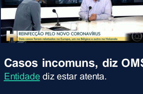
REINFECÇÃO PELO NOVO CORONAVÍRUS Dois casos foram relatados na Europa, um na Bélgica e outro na Holanda

Depois de Hong Kong, hoje foi a vez de Bélgica e Holanda informarem casos de reinfecções pelo coronavírus. Os relatos partem de especialistas diretamente envolvidos no enfrentamento da pandemia . A comunidade científica, mais uma vez, se mobilizou . Mas, assim como ontem, não se surpreendeu . Contágios reincidentes ocorrem, até agora, em baixíssima escala ( assistista ).